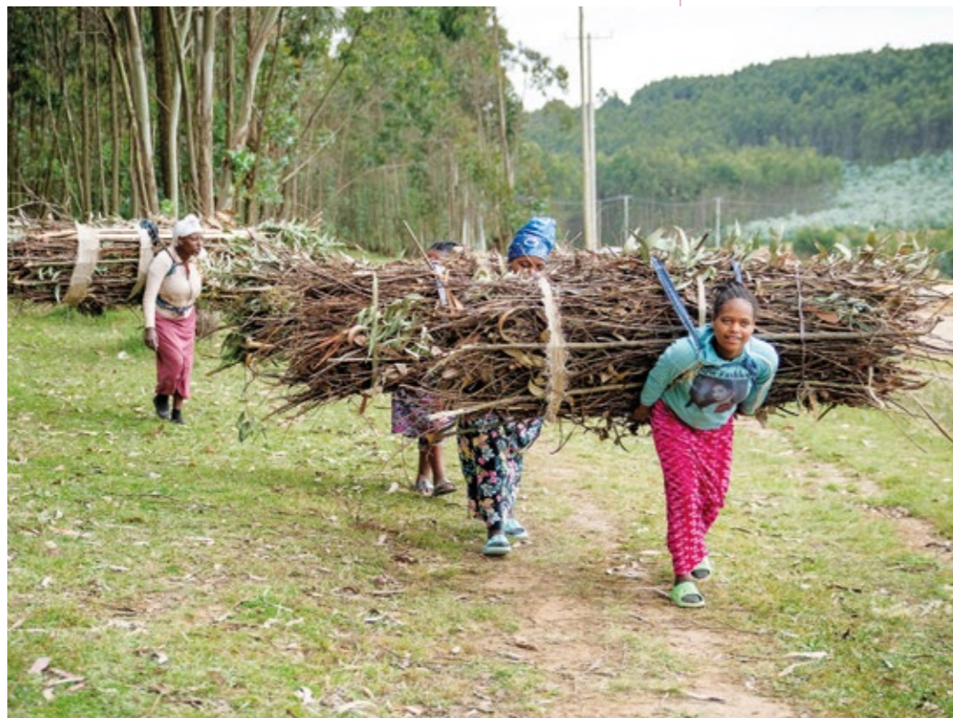
I nio timmar, varje dag, året om arbetar flickorna för att tjäna pengar till sina familjer. Trots att deras kroppar slits ut för tidigt är de stolta över att kunna bidra.

”Jag fick prova att lyfta men det var så tungt, och jag tränar ändå på gym.”