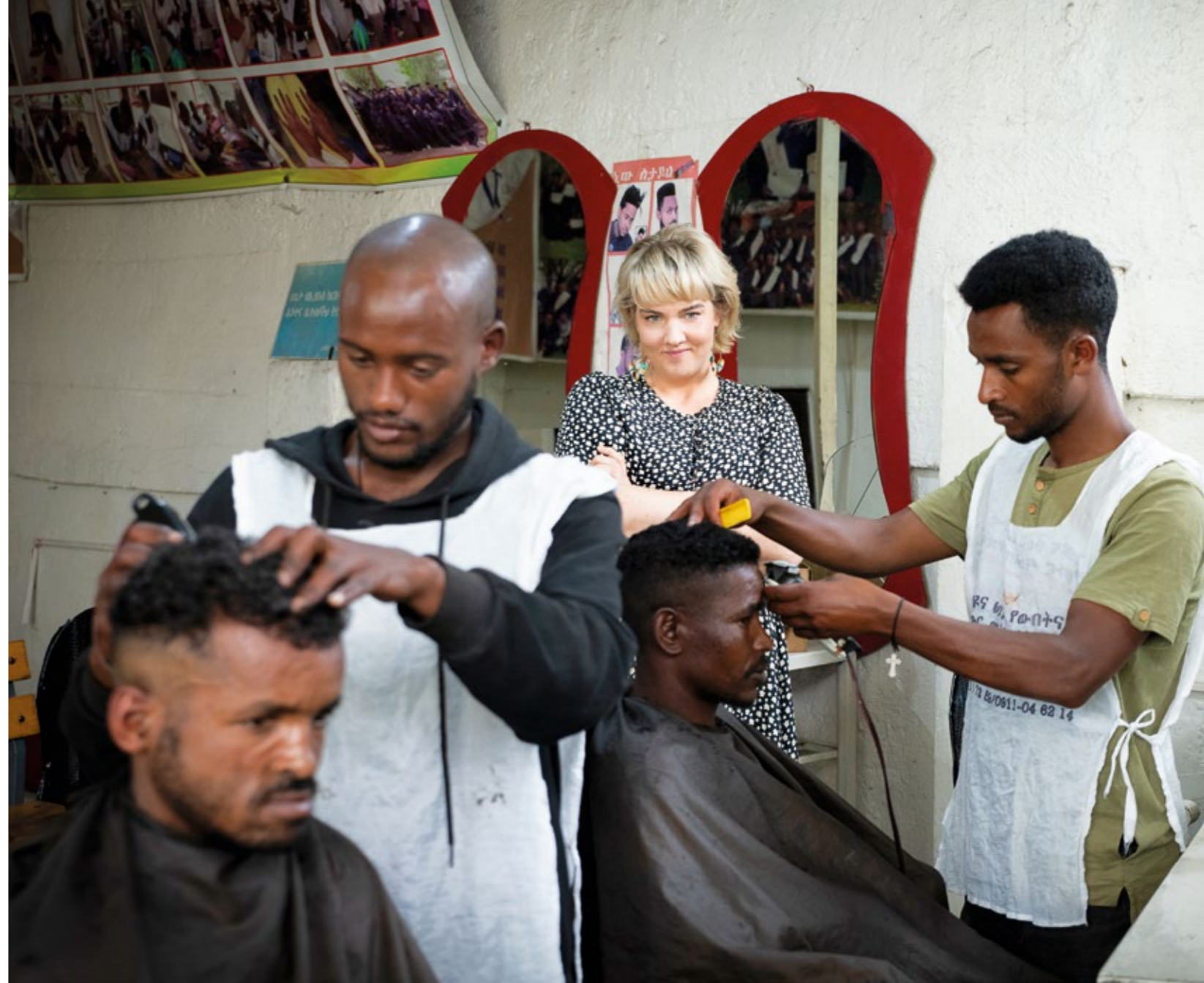
För att skapa vägar ut ur fattigdom och utsatthet, erbjuder Läkarmissionens partner utbildningar till personer som inte har gått i skola och som saknar arbete. ”Vi såg flera exempel på kreativa och bra idéer kring hur man kan hjälpa fler till ett bättre liv. Som att hemlösa får komma och bli klippta av andra som går traineeprogram för att bli frisörer”.