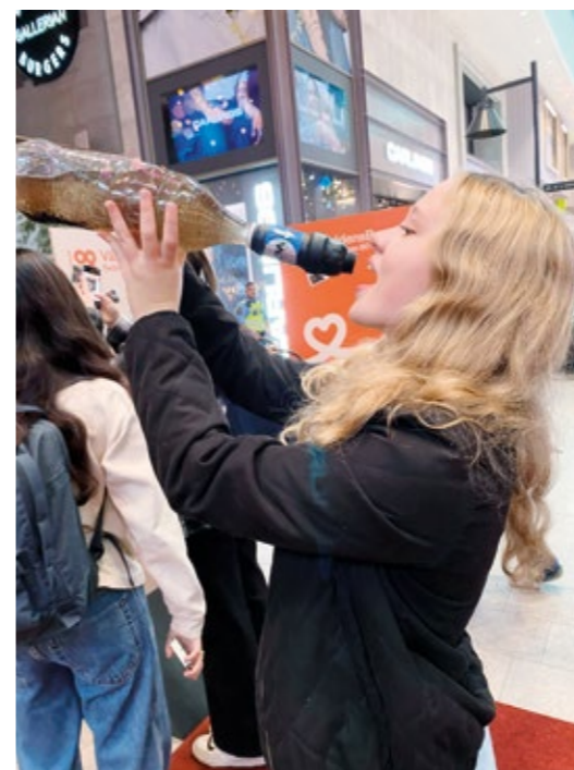
Inför Världens Barn-galan utmanade Läkarmissionen besökare i Gallerian i Stockholm.

Insamlingen till Världens Barn pågår till årets slut.