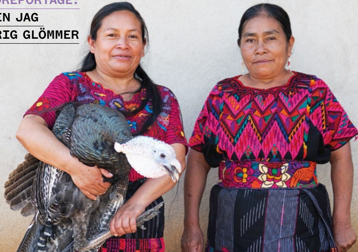
Dessa vackra kvinnor i provinsen Quiché i Guatemala har fått lära sig läsa och skriva och bidrar nu till att sprida information om Mayafolkets medborgerliga rättigheter.