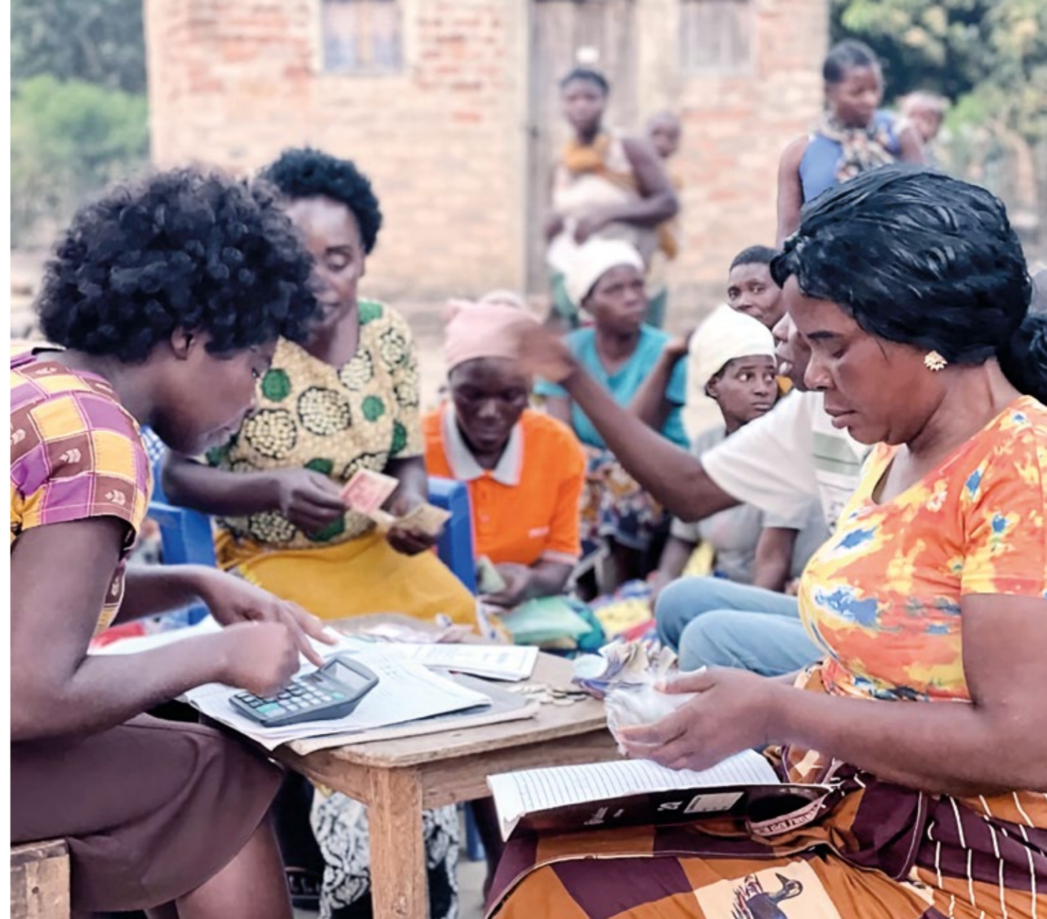
Via den medborgarstärkande metoden ”Social Audit” kunde kvinnor i lokalsamhällena beväpnade med sin nyvunna skriv- och läskunnighet ställa makthavare till svars.

Social Audit (på svenska social revision) handlar om att sänka trösklarna för medborgare att kunna hävda sina rättigheter gentemot skyldighetsbärare. I Sussandenga- och Manicaregionen har skriv- och läskunnigheten använts för att göra just detta. Genom att lära sig skriva, läsa och räkna kunde de visa på hur exakt myndigheter misslyckats med sina skyldigheter. I det andra skedet mobiliserade byarna kommittéer